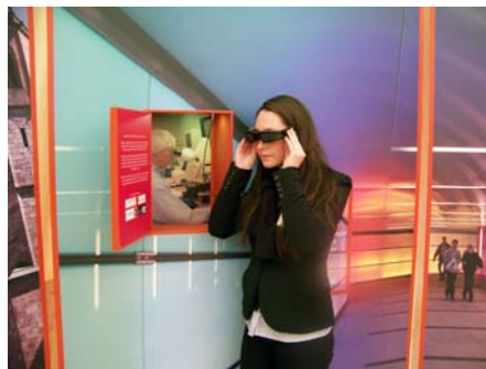
Abb. 2: Cinemizer in Aktion