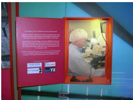
Abb. 1: Cinemizer Installation, Quelle: bpr manufactur

Weitere Informationen: www.visenso.de und http://www.lgs-vs2010.de/